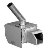
TABELA DANYCH TECHNICZNYCH